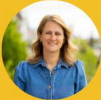
Manouk regulatory affairs