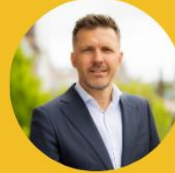
Gerwin regulatory affairs a.i.