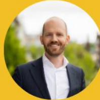
Ron sustainable finance